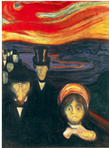
Figura 1. Ansiedad, Munch, 1894. Los rostros pálidos, los gestos crispados o el ambiente distorsionado son elementos creativos que sugieren agitación y desasosiego en el sujeto receptor.

En un estudio anterior, Flaherty (2004) vincula las disfunciones del lóbulo frontal con el bloqueo creativo –esto es, la falta de ideas originales–. La depresión es un trastorno que está asociado, precisamente, a un funcionamiento anómalo de esta región cerebral y, a menudo, se manifiesta en una falta acusada de motivación y flexibilidad cognitiva. De hecho, cuando la depresión es tratada clínicamente, se ha observado que las funciones del lóbulo frontal se normalizan en las pruebas de imagen funcional (Goldapple et al., 2004).